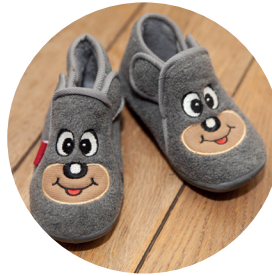
DES CHAUSSONS POUR TOUS

Pour les chenilles et papillons, prévoir du change et le nécessaire pour la sieste (couverture, oreiller, doudou), le tout dans un sac au nom de l'enfant.